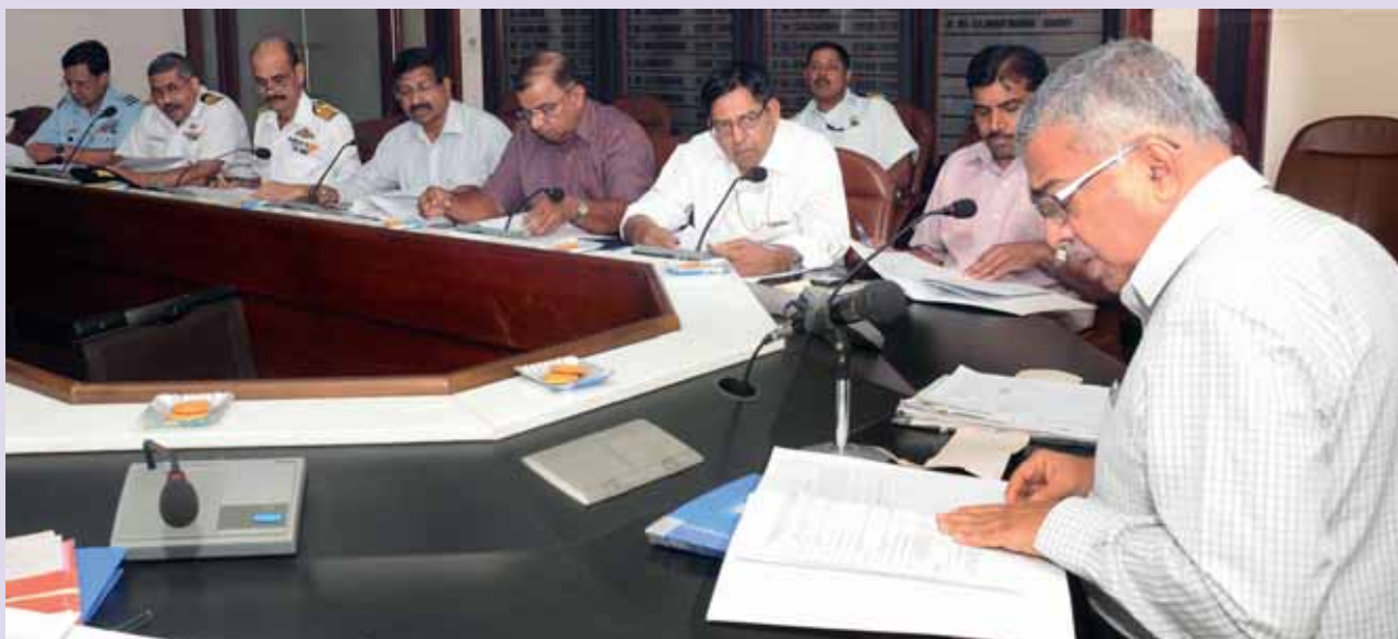
2013 ലെ സ്റ്റേറ്റ് മാനേജിംഗ് കമ്മിറ്റി മീറ്റിംഗ് ബഹു: ചീഫ് സെക്രട്ടറിയുടെ അധ്യക്ഷതയിൽ നടക്കുന്നു.