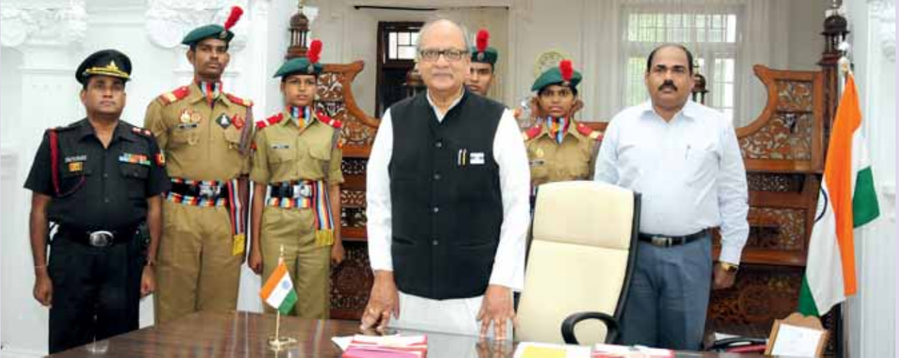
2013 ലെ സായുധസേനാ പതാകദിന ആഘോഷവേളയിൽ സൈനികക്ഷേമ ഡയറക്ടർ, എൻ.സി.സി. കേഡറ്റുകൾ, എൻ.സി.സി. യുടെ കമാന്റിംഗ് ഓഫീസർ എന്നിവർ ഗവർണ്ണറോടൊപ്പം.