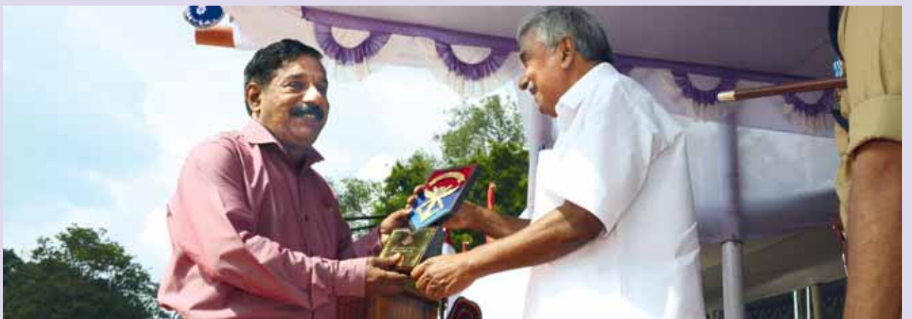
സായുധസേനാ പതാക നിധിയിലേക്ക് ഏറ്റവും കൂടുതൽ തുക സമാഹരിച്ച വിദ്യാഭ്യാസ സ്ഥാപനത്തിനുള്ള ട്രോഫി കേന്ദ്രീയ വിദ്യാലയം പട്ടം തിരുവനന്തപുരത്തിന് വേണ്ടി സ്കൂൾ പ്രിൻസിപ്പൽ സ്വീകരിക്കുന്നു.