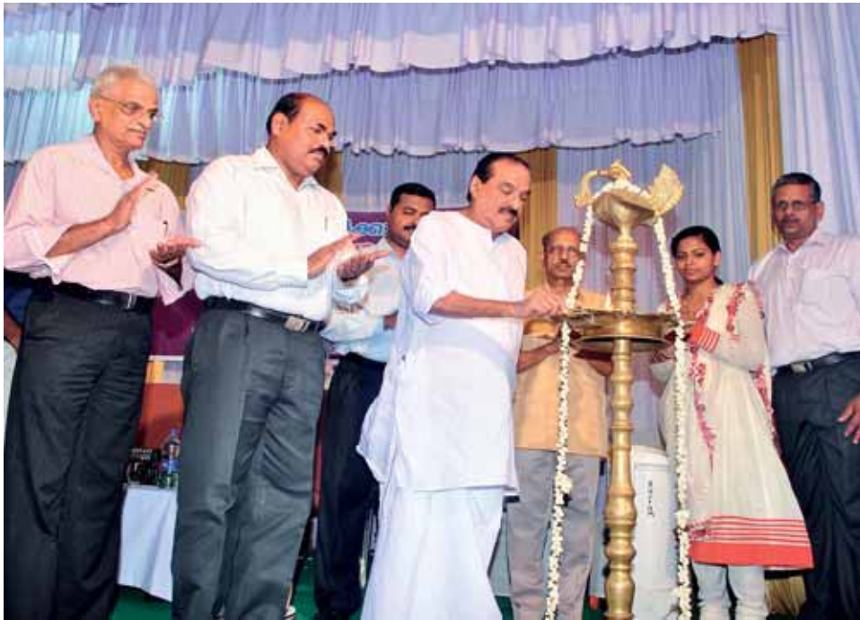
23-02-2014 ന് കോട്ടയത്ത് നടന്ന സംസ്ഥാനതല വിമുക്തഭട സംഗമം ബഹു. ധനകാര്യ വകുപ്പ് മന്ത്രി ശ്രീ. കെ.എം. മാണി ഉദ്ഘാടനം നിർവ്വഹിക്കുന്നു.