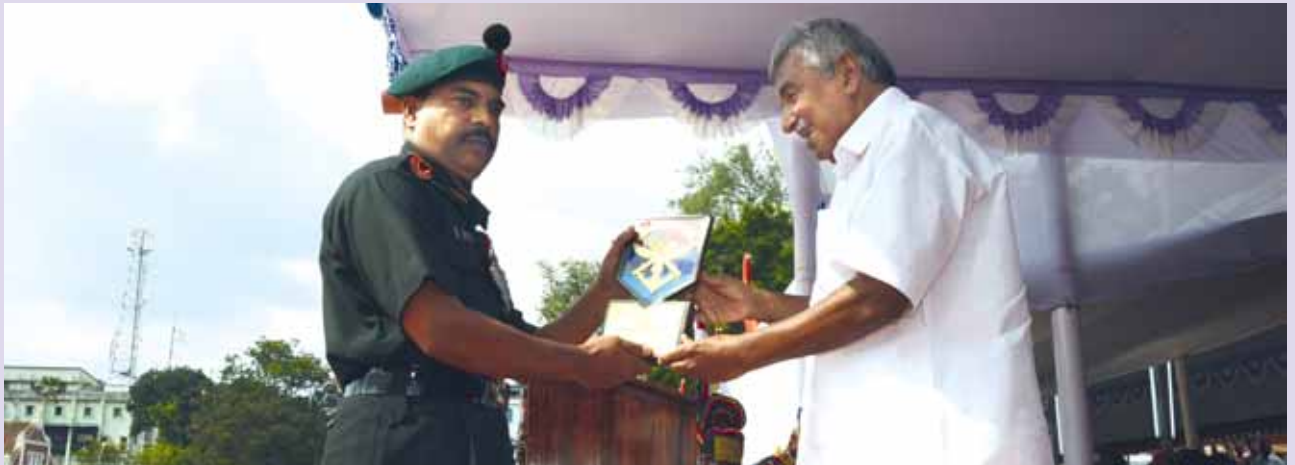
സായുധസേനാ പതാക നിധിയിലേക്ക് ഏറ്റവും കൂടുതൽ തുക സമാഹരിച്ച എൻ.സി.സി. യൂണിറ്റിനുള്ള 29 കേരളാ എൻ.സി.സി. ബ്രാച്ചിയൻ കോഴിക്കോടിനു വേണ്ടി സ്വീകരിക്കുന്നു.