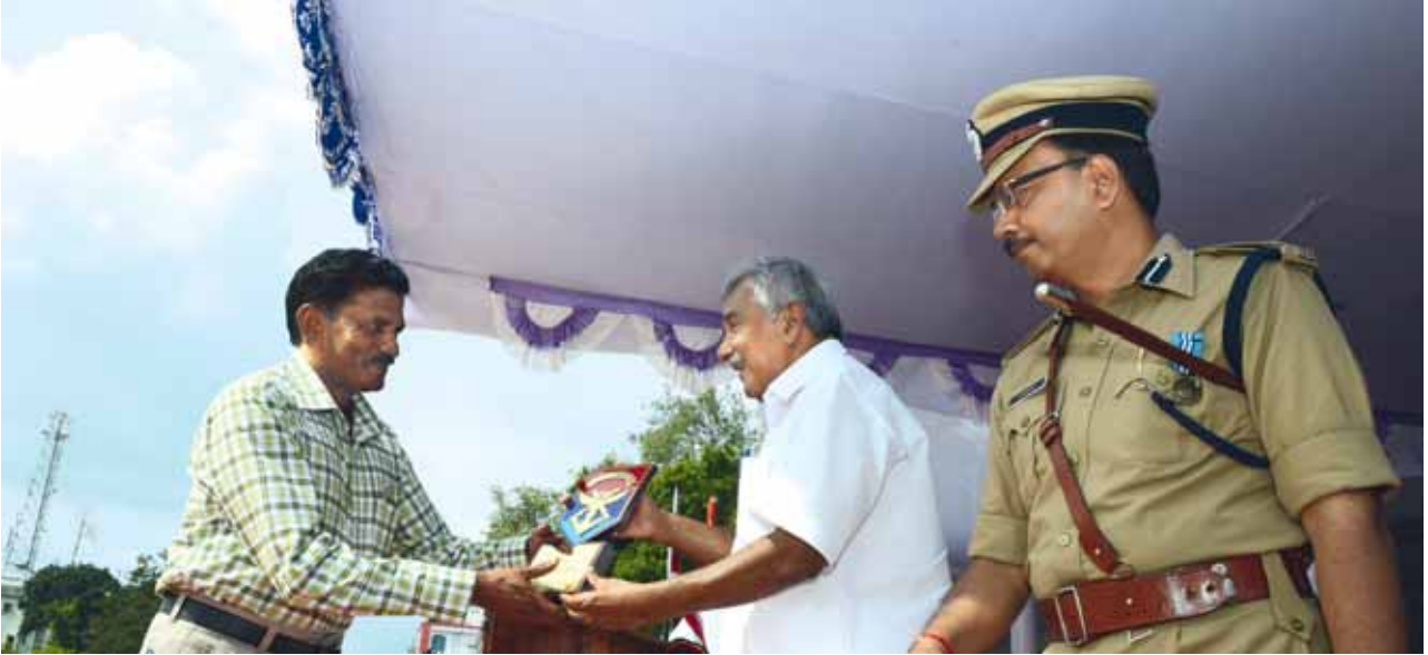
സായുധസേനാ പതാക നിധിയിലേക്ക് ഏറ്റവും കൂടുതൽ തുക സമാഹരിച്ച ചെറിയ ജില്ലയ്ക്കുള്ള ട്രോഫി കാസർഗോഡ് ജില്ലാ സൈനിക ക്ഷേമ ഓഫീസർ സ്വീകരിക്കുന്നു.