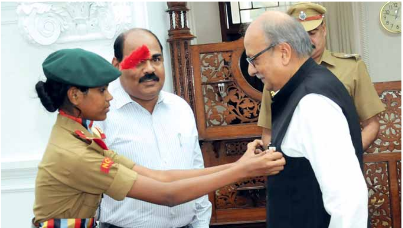
2013 ലെ പതാക ദിനാചരണത്തിന്റെ ഭാഗമായി ഹഹുമാനപ്പെട്ട ഗവർണ്ണർ എൻ.സി.സി. കേഡറ്റിൽ നിന്നും പതാക സ്വീകരിക്കുന്നു.

2013 ലെ പതാക ദിനാചരണത്തിന്റെ ഭാഗമായുള്ള സംസ്ഥാനപതാക വില്പനയുടെ ഔദ്യോഗിക ഉദ്ഘാടനം 05.12.2013 ൽ നടന്ന ചടങ്ങിൽ നൽകിയ ടോക്കൺ പതാക സ്വീകരിച്ച് ബഹുമാനപ്പെട്ട ഗവർണ്ണർ നിർവ്വഹിച്ചു.